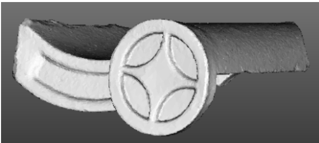
図5. 3Dモデリングビューア（フラット）