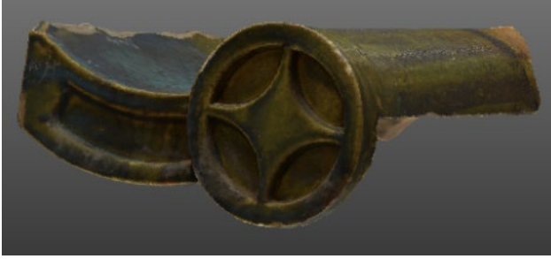
図4. 3Dモデリングビューア（標準）